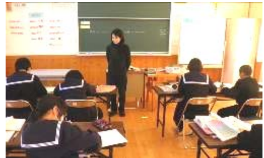
12月19日(月)1年生の授業風景