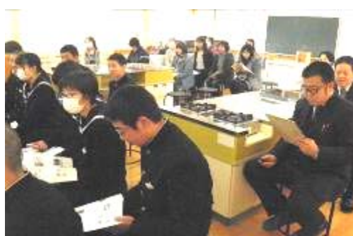
生徒・保護者・職員