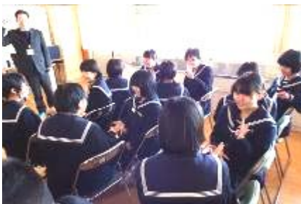
じゃんけんゲーム