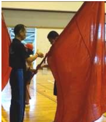
団旗授与(甲斐団長)

今年から名称も「田原小・中学校大運動会」になりました。昨年度から得点及び応援賞も一本化していましたが、名称も大運動会に変更しました。