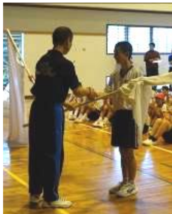
団旗授与(新名団長)