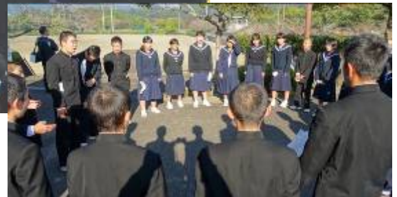
会場の外で練習しました