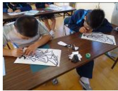
カッターナイフで切り抜きます