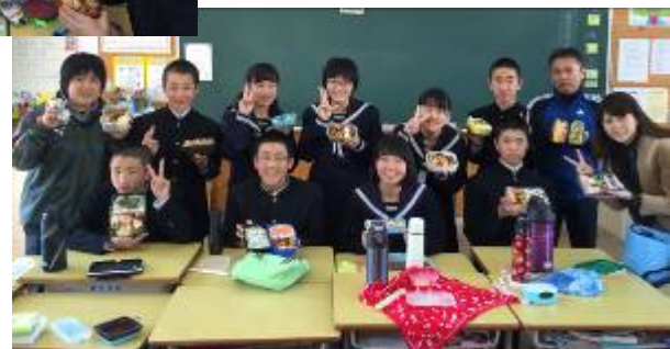
野菜をうまく使って美味しそうです