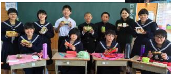
みんないい笑顔です