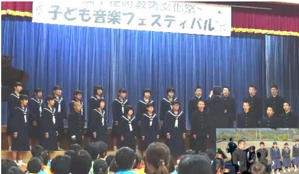
素晴らしいハーモニーで観衆を魅了しました

その日の午後、学校前の道路を歩いている時に、1台の車が止まって「先生、見に行きましたよ。田原中は素晴らしかったですね」と地域の女性の方に声を掛けていただきました。ありがとうございました。本当にいい1日でした。