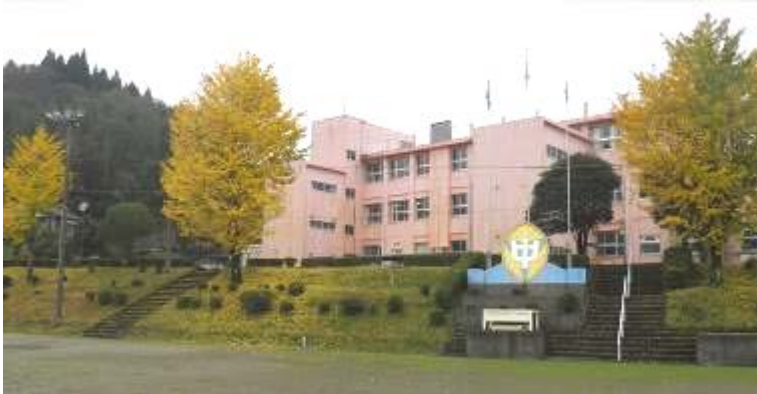
運動場から見た校舎

学校には銀杏の木が多く、鮮やかな黄色が映えますね。そして、地面に落ちた葉が、黄色い絨毯を敷き詰めたようで美しいです。