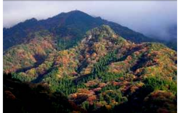
屋上から見た紅葉の山々