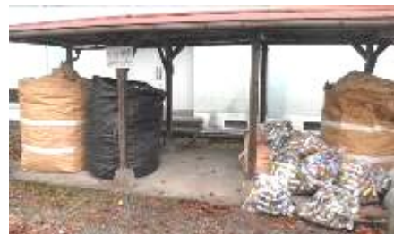
体育館横の回収場所