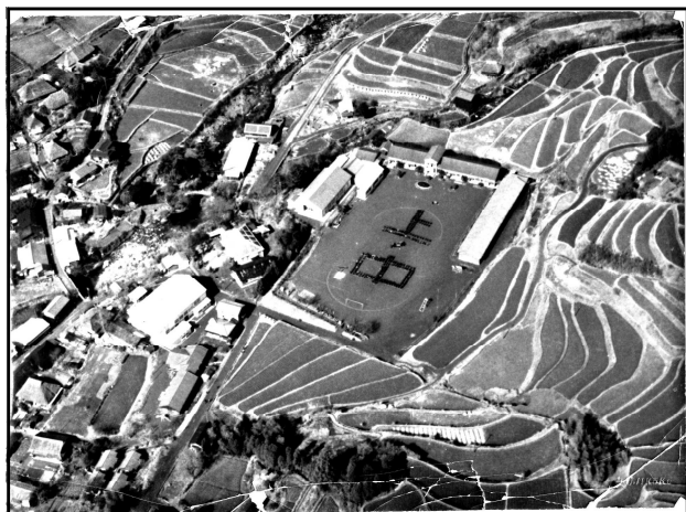
昭和34年頃の上野中

来校された卒業生の皆様から、子どもたちに図書券を贈呈していただきました。早速、図書館に本を購入し、子どもたちも大喜びです。本当にありがとうございました。