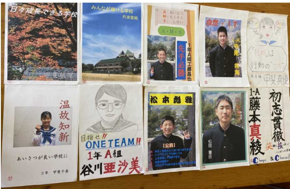
▲立候補者の生徒が自作した選挙ポスター

生徒会役員改選の選挙が10月22日に行われます。役員選挙に際し、2年生3名、1年生7名の生徒が立候補してくれました。とても立派で頼もしいことです。 自作のポスターには、どんな学校にしたいかやどんなことに取り組みたいかなど、それぞれの思いが、絵や写真、力強い文字などによって工夫して込められていました。これからの学校をリードするため、がんばって下さい！