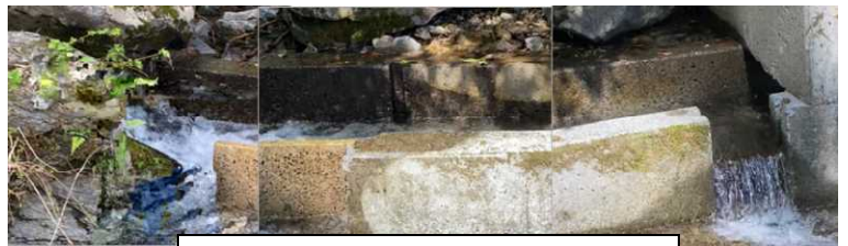
樫木尾集落用水の取水口