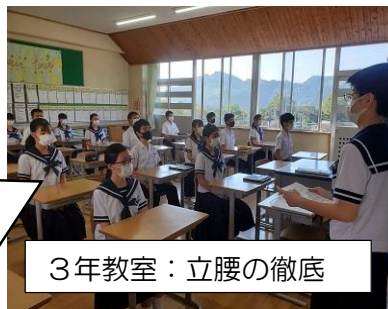
3年教室：立腰の徹底

朝の会では、立腰の ポイントをみんな で確認。チェックカ ードを使って授業 の前後にも立腰を 意識しています。