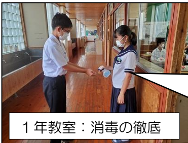
1年教室：消毒の徹底