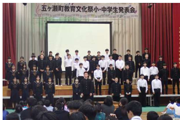
町教育文化祭の様子

町教育文化祭では、200 名以上の観客の前で歌うのもなかなかできない経験で、緊張した事でしょう。学んだこと(知識)を使って表現する姿は、学校教育が求めている子どもの姿です。これらの経験は、自信につながっていくと思います。