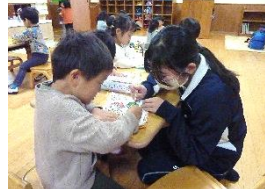
保育園訪問／月1～2回 (希望者 放課後)