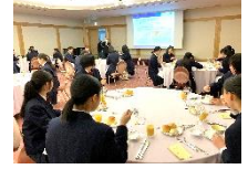
テーブルマナー講習会