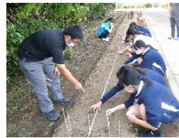
家庭クラブ菜園 (季節の野菜)