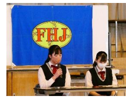
家庭クラブ総会 (5月実施)