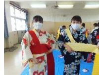
ゆかた着付講習会