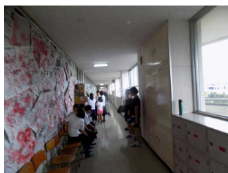
二学年クラス展示