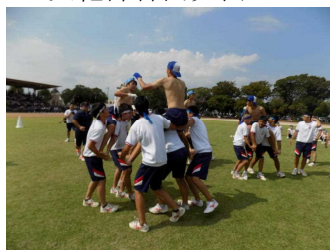
体育大会 3年男子団技