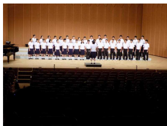
クラス合唱コンクールでは1年6組が最優秀賞を受賞しました。優秀賞3年7組・優良賞1年7組

（MJ部門）では、ダンス部、放送部、音楽部、吹奏楽部などの部活動の発表や、中学生合唱、高校生合唱コンクール決勝、いずみアーティストステージ（個人発表）などが行われました。二日目（本校部門）では、美術部、書道部、華道部、新聞部、化学部、物理部、生物部、ユネスコ部、茶道部、文芸部、囲碁将棋部などの展示や、家庭クラブによるバザーや熊本 東日本大震災復興支援募金、献血、中学生クラス展示、高校1年生学年展示、高校2年生クラス展示、図書委員会による映画上映、いずみアーティストステージなどが行われました。三日目の体育の部では、各団とも3年生の団長の指揮の下、熱のこもった様々な競技が行われた結果、今年度は総合の部は赤団の、応援の部は赤団と青団の優勝となりました。