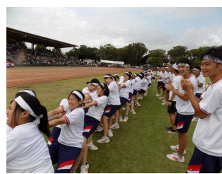
体育大会 3年女子団技