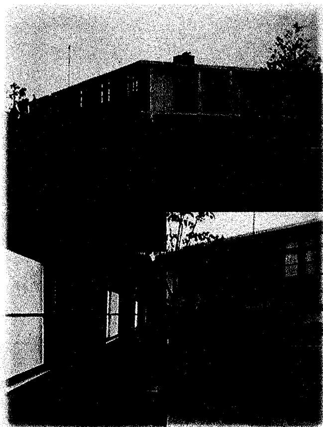
昭和41年 改築された同文学寮