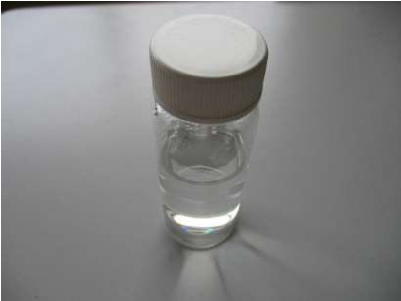
水酸化ナトリウム