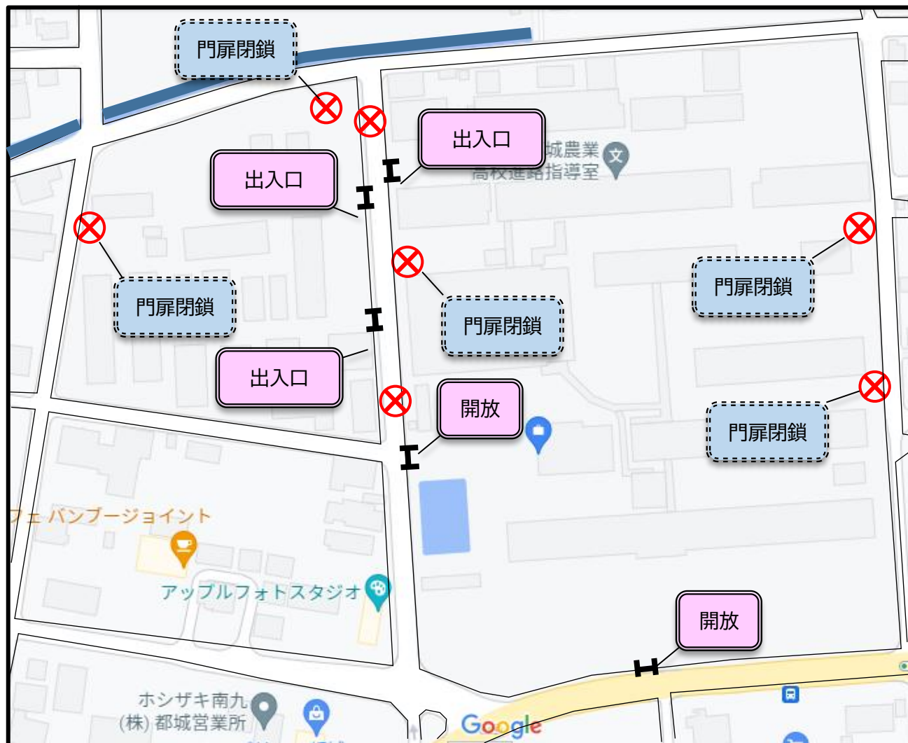
〈1〉 校内配置図（本校駐車場・出入口）