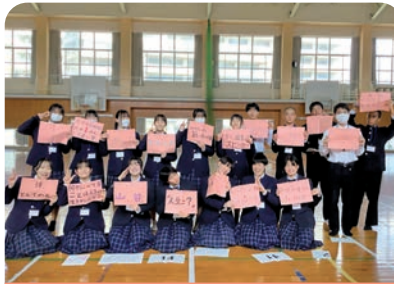
小中学生向け「ことのはプロジェクト」