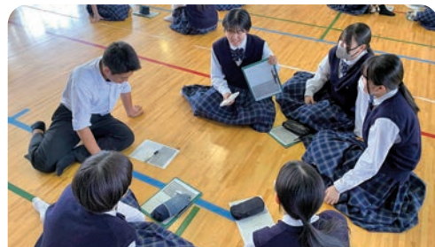
チームビルディングのためのワークショップ