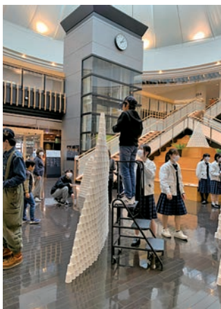
まちに出て様々な探究活動