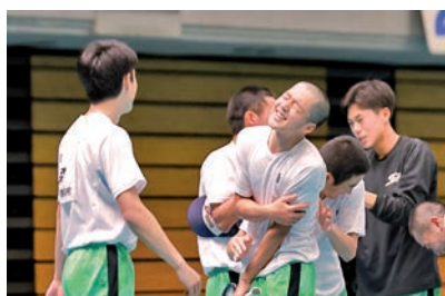
男子ソフトテニス部