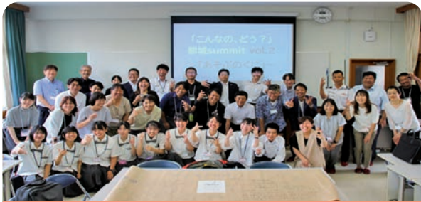
こんなはどう?都城summit2