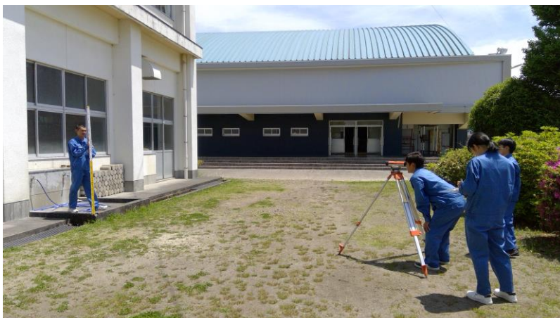
測量で、高さ（段差）を測っています。