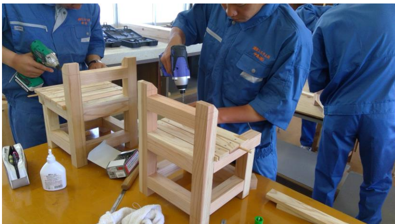
木工で、椅子を作っています

1年生が工業高校へ入学して、2か月が過ぎようとしています。実習が始まり、建設技術者への第一歩がスタートしました。