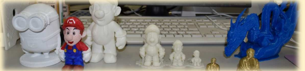
情報制御システム科：3Dプリンター作品