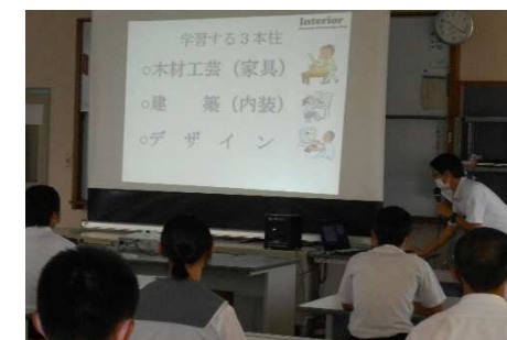
インテリア科：学科説明