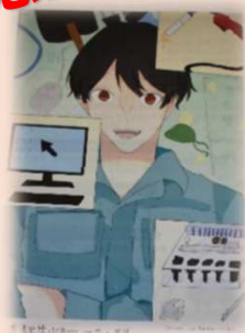
情報制御システム科 ：紙ファイル