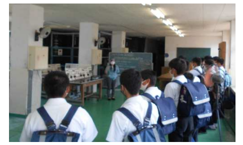
電気科：モーター実験