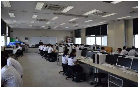
情報制御システム科：学科説明