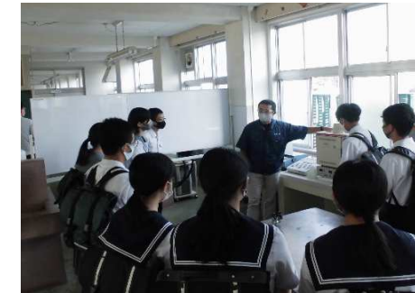
化学工業科：アルコール濃度測定