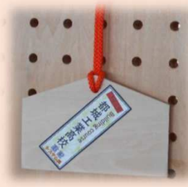
建設システム科 ：絵馬“合格祈願”