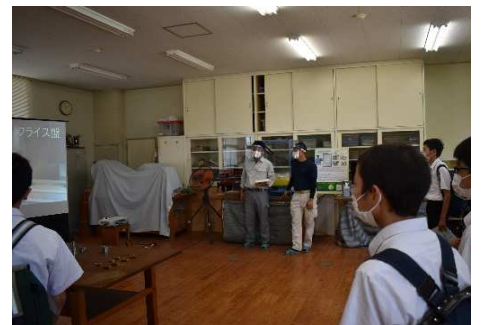
情報制御システム科：作品紹介