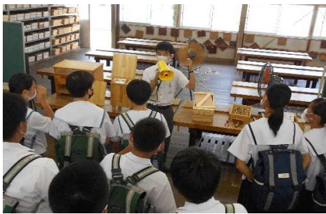
インテリア科：木工