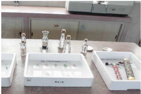
化学工業科：実習作品