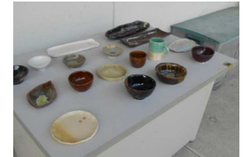
インテリア科：実習作品