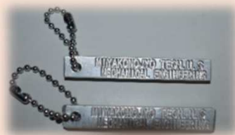
機械科：キーホルダー