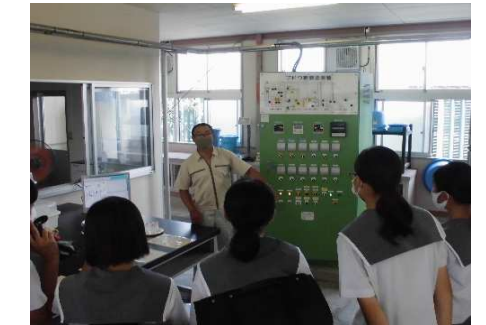
化学工業科：水あめ製造実習