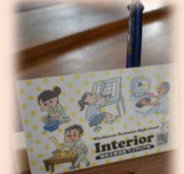
インテリア科：ペン立て