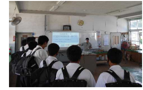
電気科：電気工事士