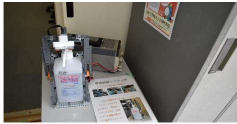
情報制御システム科 アルコール消毒センサー