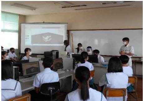
建設システム科：CAD設計