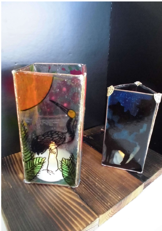
「花札のランプ」 K K