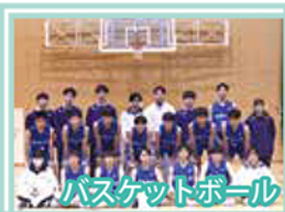
バスケットボール