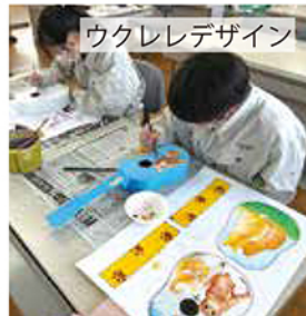
ウクレレデザイン