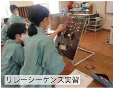
リレーシーケンス実習