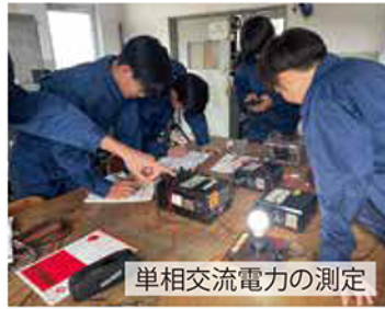
単相交流電力の測定