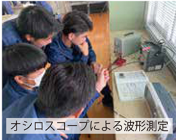
オシロスコープによる波形測定