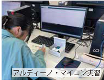
アルディーノ・マイコン実習