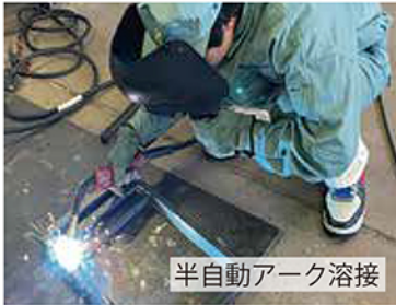
半自動アーク溶接