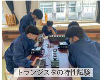
トランジスタの特性試験