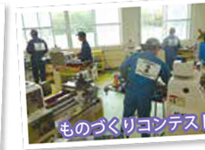
ものづくりコンテスト