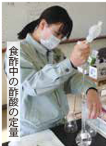
食酢中の酢酸の定量