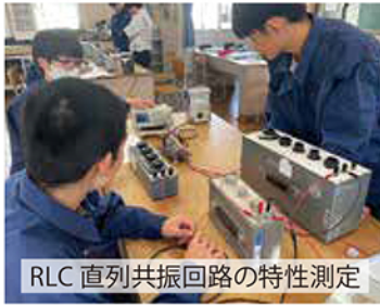
RLC 直列共振回路の特性測定