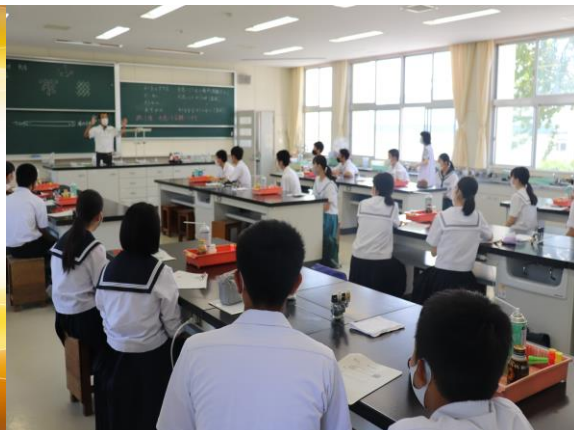
(昨年度の模擬授業)

中学生のみなさん、いよいよ次の ステップへ向かう1年になりました。 自分の夢・目標に向かって、大きく 躍進できる一步を踏み出せるよう 都城西高校を体験に来ませんか。 (詳細は裏面)