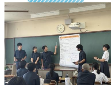
探究活動 （避難訓練を変えよう！）