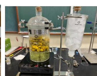
課題研究（生徒それぞれが興味あることを研究します）