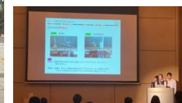
発表会への参加（積極的に挑戦します！英語でも発表します。）