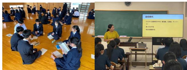
立志クラブ（先輩が多くのことを教えてくれます）