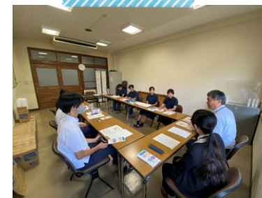
調査活動 （研究のための聞き取り）