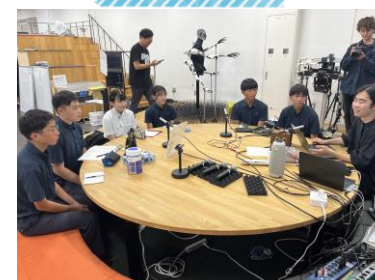
東京大学での現地実習 （最先端研究を体験します）