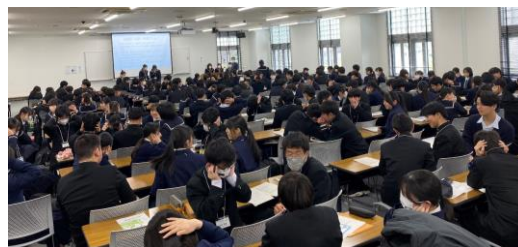
合同学習会（他校の生徒と学びを深めます）