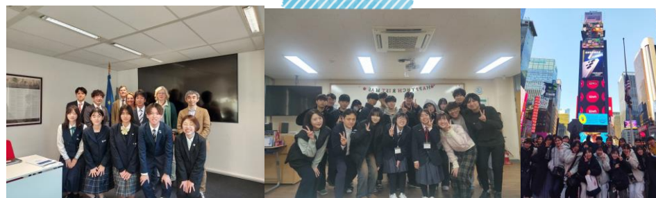
海外での学び（多くの生徒が海外での学びを実践しています） ・アグロポリス大会優勝（EU本部へ視察） ・韓国修学旅行プロデュース大会優勝（韓国ヘモニーツアー） など