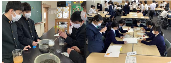
実験会や研究会への参加 （実験や研究を通して、他校生と学びを共有します）