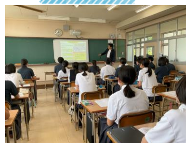
探究の基礎を学ぶ （大学教授からの学び）