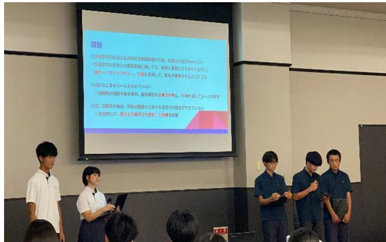
4. 共生社会シンポジウム 小林こすもす支援学校との連携