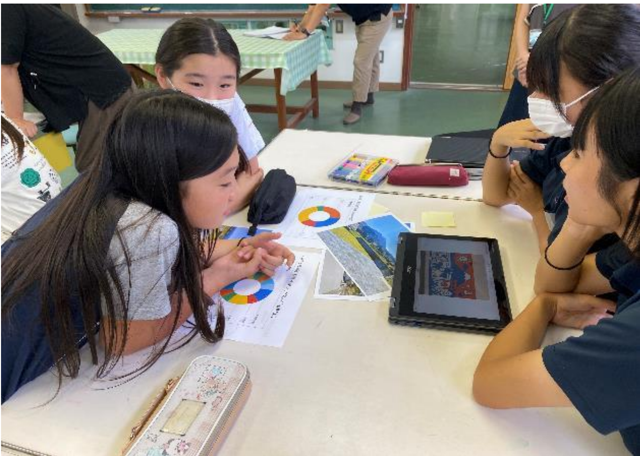
小学生と壁画作成の打ち合わせ