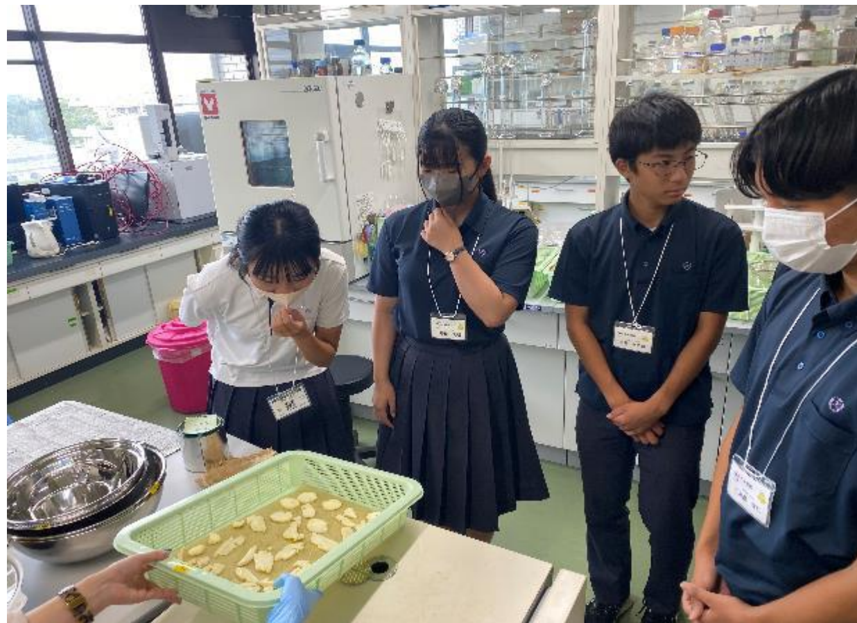
宮崎大学研究室訪問