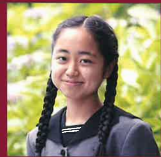
延岡高等学校 生徒会長

このパンフレットに描かれている先輩方のように、本校を志望する皆さんが、延高の先輩方、先生方と一緒に充実した高校生活を送ることを楽しみにしています。ともに学び、ともに活躍し、延高の新しい1ページを作りましょう。