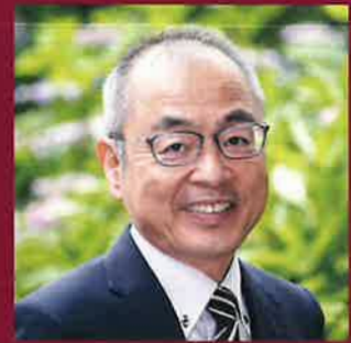
延岡高等学校 校長

民間パイロットとして国内第1号の一等操縦士、一等飛行士である。旧制延岡中学校の第11回卒業生。