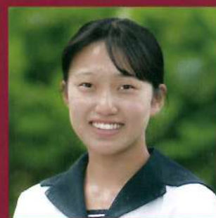
延岡高等学校 生徒会長

「高校を決める」ということは「何の学びに取り組むか」ということにもなります。ノベタカは進学を基本とした学びです。それ故に、多くの分野への進学が実現しています。自分の進路や将来に対し、多角的に考えていく場所としてノベタカを選択するのも一つかと思えます。皆さんに会えることを楽しみにしています。