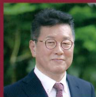
延岡高等学校 校長

民間パイロットとして国内第1号の一等操縦士、一等飛行士である。旧制延岡中学校の第11回卒業生。