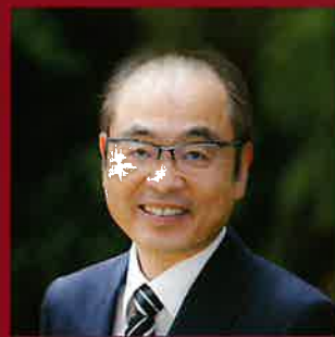
延岡高等学校 校長

民間パイロットとして国内第1号の一等操縦士、一等飛行士である。旧制延岡中学校の第11回卒業生。