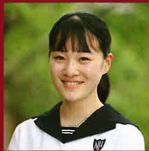
延岡高等学校 生徒会長

このパンフレットに描かれている先輩方のように、本校を志望する皆さんが、延高の先輩方、先生方と一緒に充実した高校生活を送ることを楽しみにしています。ともに学び、ともに活躍し、延高の新しい1ページを作りましょう。