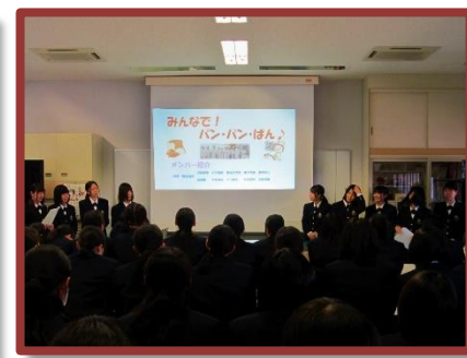
電気電子科ではエアホッケー、生活工学科ではパン作り活動などが披露