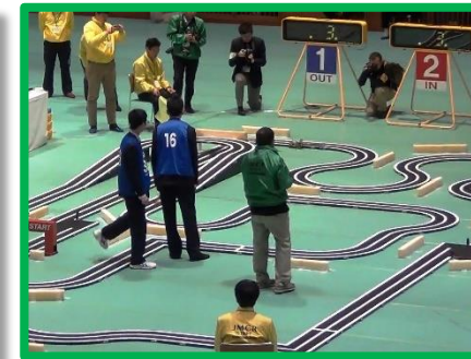
(左)準決勝と(右)決勝。クランクでの曲がり角が勝敗を分けました。