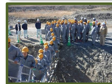
北川町の河川漏水対策工事も見学。漏水の現状などについても説明がありました。