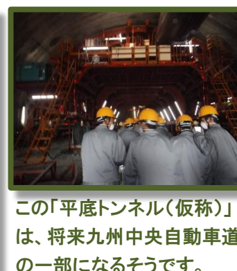
この「平底トンネル(仮称)」は、将来九州中央自動車道の一部になるそうです。