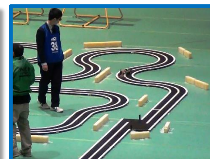
(左)予選1回目クランク手前で脱輪 (右)2回目は正確に走りきり、予選3位