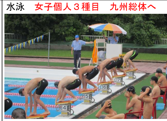
水泳 女子個人3種目 九州総体へ