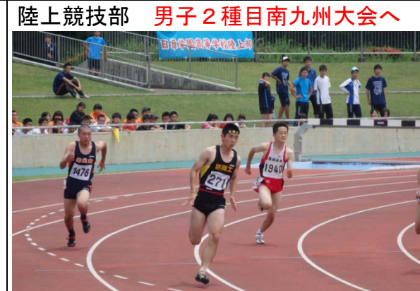
陸上競技部 男子2種目南九州大会へ