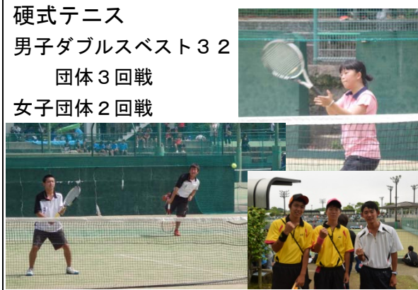
硬式テニス 男子ダブルス ベスト3 2 団体 3回戦 女子団体 2回戦