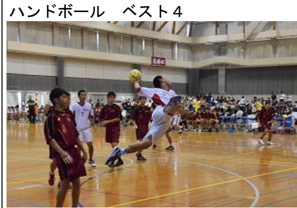
ハンドボール ベスト4