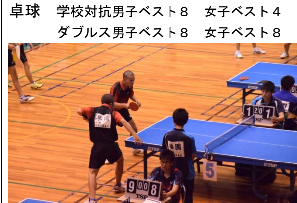
卓球 学校対抗男子 ベスト8 女子 ベスト4 ダブルス男子 ベスト8 女子 ベスト8