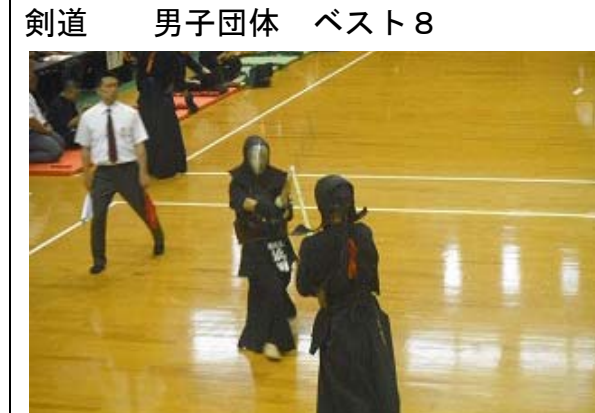
剣道 男子団体 ベスト8