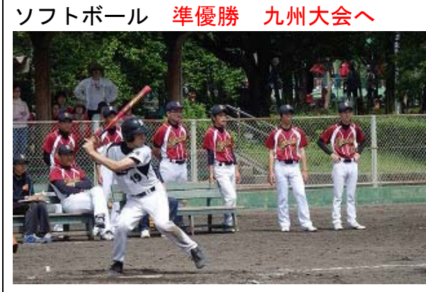
ソフトボール 準優勝 九州大会へ