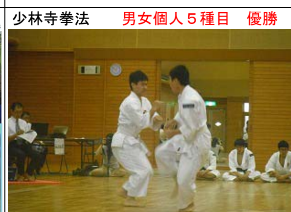
少林寺拳法 男女個人5種目 優勝