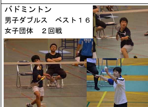
バドミントン 男子ダブルス ベスト16 女子団体 2回戦