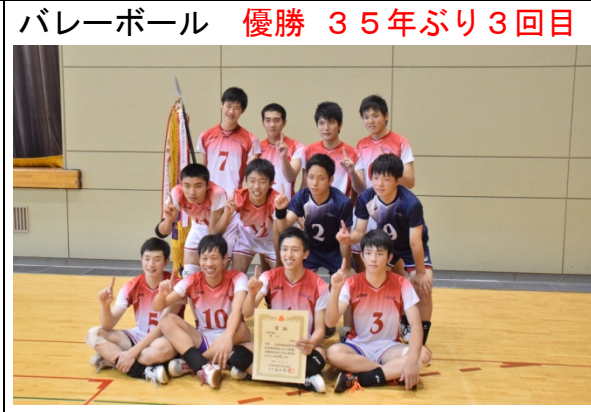
バレーボール 優勝 35年ぶり3回目