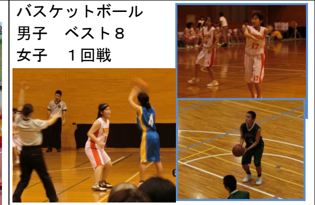
バスケットボール 男子 ベスト8 女子 1回戦