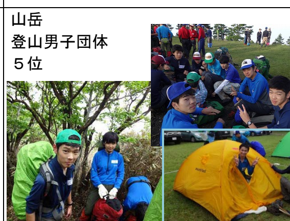
山岳 登山男子団体 5位