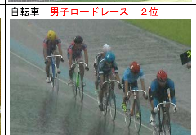
自転車 男子ロードレース 2位