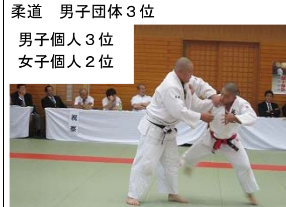
柔道 男子団体3位 男子個人 3位 女子個人 2位