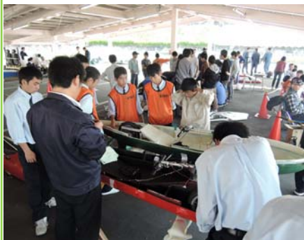
大会前の車体整備の様子(1号車)

10/25(日)に、宮崎ドライビングスクール(宮崎市)を会場に、県内6校 県外2校から16台が熱い戦いを繰り広げました。エコ電カーは、指定された電池でどれだけ長い距離を走れるかを競うもので、鉛蓄電池・充電乾電池10本の2クラスあります。電池10本で、自動車学校のコースを17周(多いものは31周)も回ります。本校は全体で8位だったので、今後、更なるマシン性能の向上を目指し頑張ります！