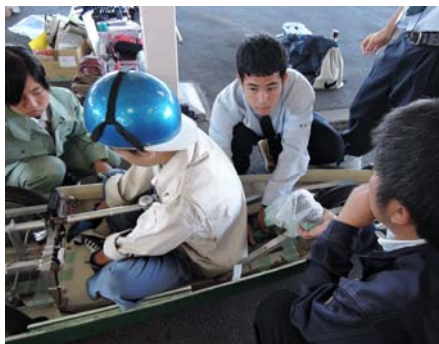
女子部員も活躍!(2号車)