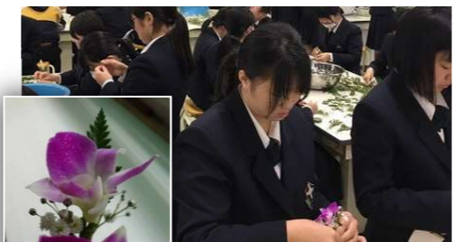
卒業生のコサージュは生活文化科の手作りです。