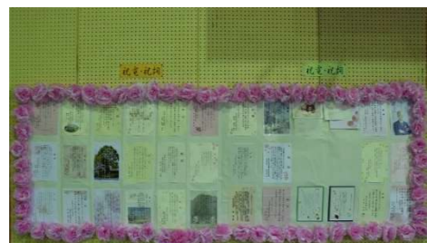
たくさんの祝電・祝詞をいただきありがとうございました。