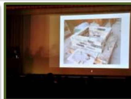
土木科はセメントを活用した囲炉裏製作