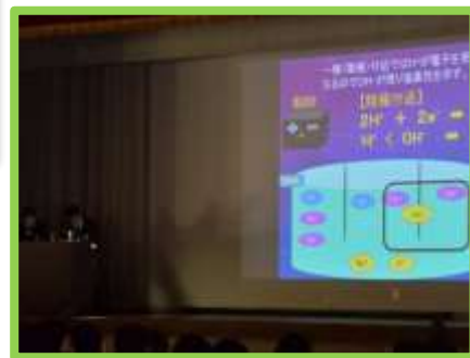
環境化学システム科は、自然界にある色素について研究。高校3年間で学んだ知識・技術を研究に活かしました。