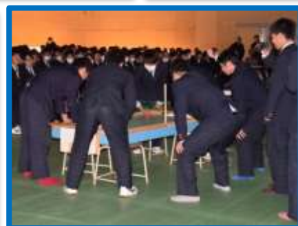
電気電子科はエアホッケーの実演

2月2日、各学科の代表者による「課題研究発表会」が行われました。3年生たちは1年間をかけて様々な研究・製作を行い、その成果を実演や動画を交えながら発表しました。