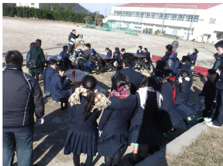
本校グラウンドでの説明

1月19日（火）、延岡しろやま支援学校の2年生20名が来校し、実習体験等を通して交流を深めました。本校からは、新・旧生徒会役員19名が参加しました。