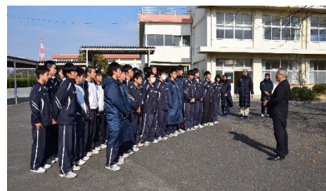
帰校したときの様子