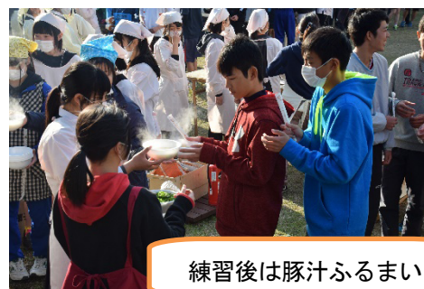
練習後は豚汁ふるまい