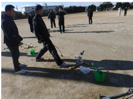
ロケットを飛ばす様子