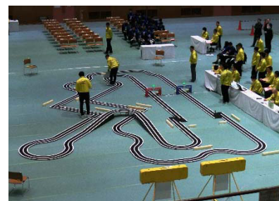
当日発表されたコース