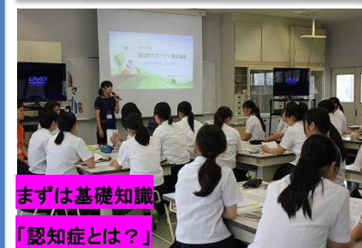
まずは基礎知識 「認知症とは？」