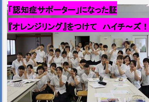
「認知症サポーター」になった証 『オレンジリング』をつけて ハイチ～ズ！