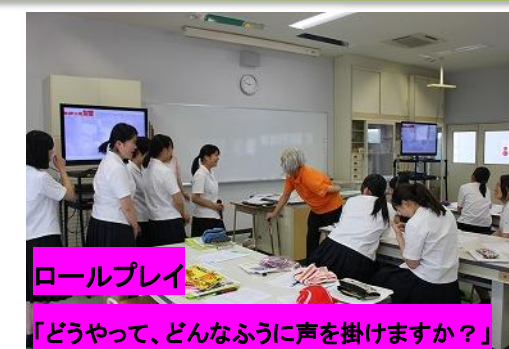
ロールプレイ 「どうやって、どんなふうに声を掛けますか？」