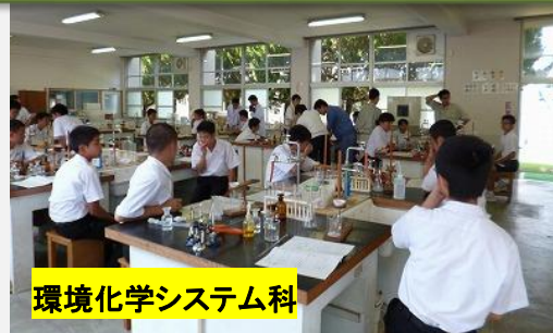
環境化学システム科