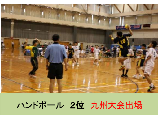
ハンドボール 2位 九州大会出場