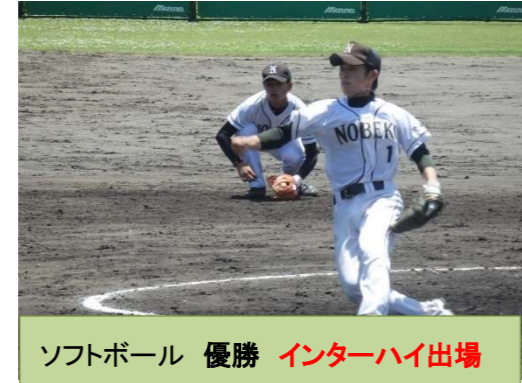
ソフトボール 優勝 インターハイ出場

男子5000m 優勝 佐藤さん(電 東海中出身) 男子400m 4位・200m 5位 川崎さん(電 南中出身) 男子4x100m R 3位 (柳田、川崎、椿、稲岡) 男子4x400m R 4位 (川崎、甲斐、柳田、内越) 南九州大会・インターハイ出場