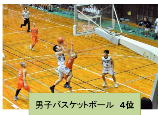
男子バスケットボール 4位