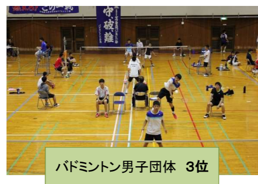
バドミントン男子団体 3位