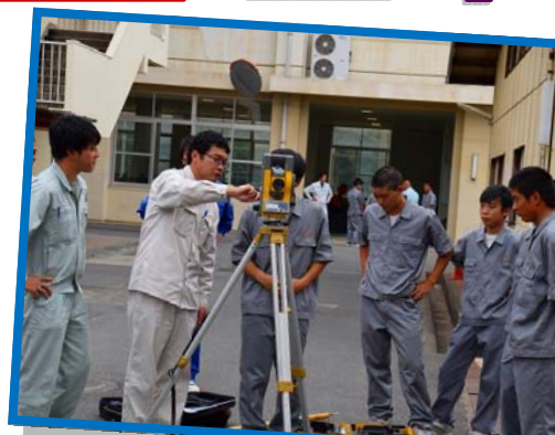
測量機器「トータルステーション」の指導

6月16日(金)に行われた、測量技術講習会の様子です。県北にある測量設計企業の技術者より、ドローンなど最新の測量機器の扱い方についてご指導いただきました。