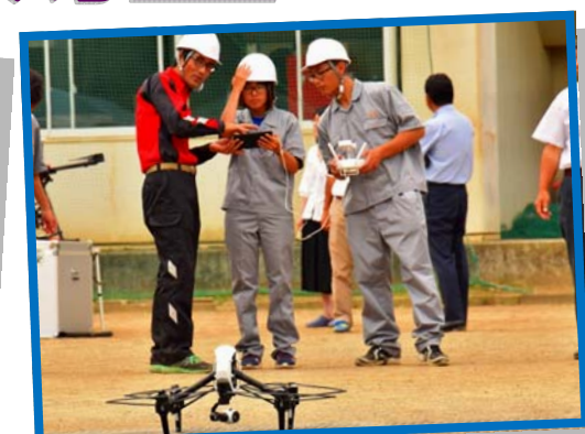
ドローンの操作方法や空中撮影について教えていただきました