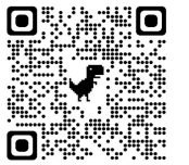
避難時 予想危険箇所-2 ×8～13