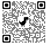
避難時 予想危険箇所-1 ×1～7

マップ内の×印は避難時の予想危険箇所を示しています。下のQRコードを読み込むと写真が表示されます。