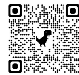
避難時 予想危険箇所-2 ×8～13