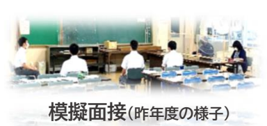
模擬面接(昨年度の様子)

頑張れ受験生!!そして、読んでくれているより若い皆さん、さあ！高千穂高校で、あなたの未来を創ってみませんか！