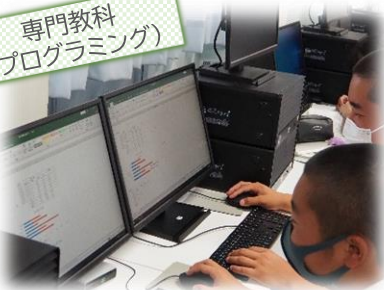
専門教科 (プログラミング)