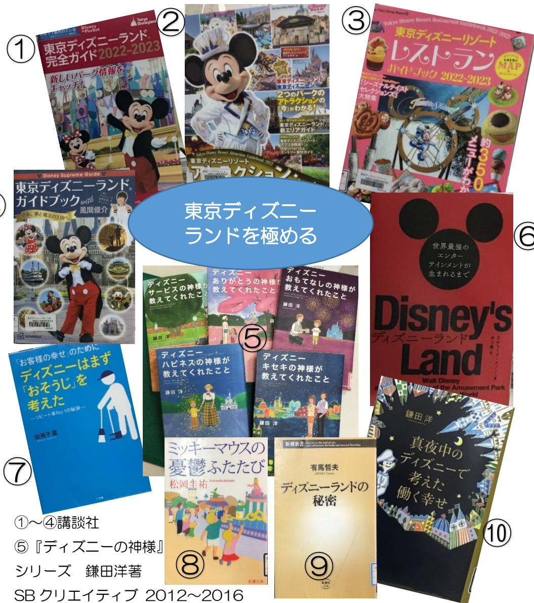
東京ディズニーランドを極める