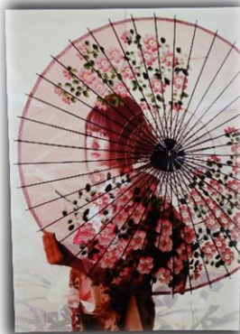
『ヒト部門』特選作品 (写真部)

師走です。この一年、いろいろなことがありました。新型コロナウイルスに世界は翻弄され続けています。予測不能な状況がこの先も続くことは否めません。ただ言えることは、臨機応変に対応する姿勢を自ら作り上げていくことが「生きる」ことを支えるベースになるのではないかということです。こうして考えると、みなさんが日々受けている授業の中での様々な探究プロセスはまさに、その力を育てていることになります。