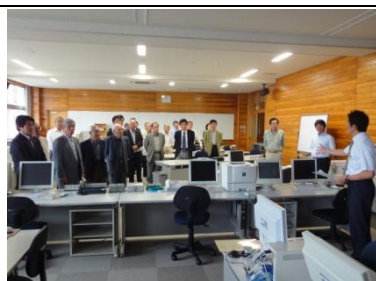
商業実践室での説明