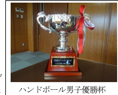
ハンドボール男子優勝杯