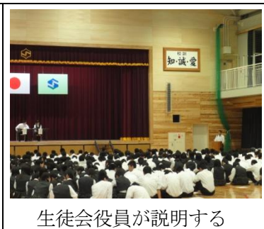
生徒会役員が説明する

とを考慮して検討していくなどの必要があると思っています。クラスマッチや文化祭についても意見が出ましたので、生徒会と話し合っていくことになります。秀峰の学校行事の在り方について十分に話し合い、よりよい学校行事となるようにしていけたらと考えています。