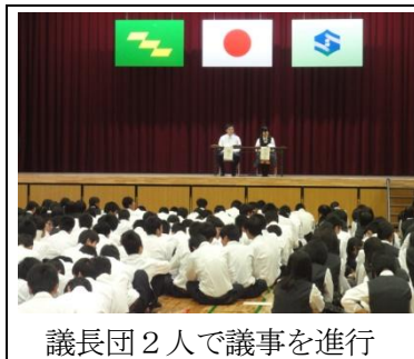
議長団2人で議事を進行

○平成23年度の生徒会活動方針・活動計画、生徒会予算案、並びに部費配分等が承認されました。