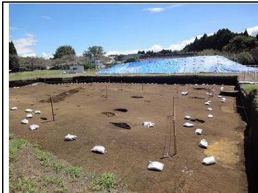
遺跡発掘現場 土山ができる

○高原高校の馬術部練習場跡地に、秀峰農場の管理棟・牛舎を建設するため、6月から9月中旬まで、遺跡の発掘作業が行なわれています。縄文時代の遺跡が発掘され、広原第1遺跡と命名されています。縄文時代後期中頃の土器や石器が数多く出土し、その時代に掘られた穴が見つかっています。住居跡の柱を立てた穴、食料貯蔵のための穴などです。土器は「市来式」と呼ばれる南九州系のものが主体。磨石や石皿など、木の実や植物をするつぶすための石器も見つかっています。現地には、発掘のために掘り出された土が山となっています。霧島の火山灰などが降り積もって、地層をなしているのがよく分かりました。遺跡に堆積した火山灰から、過去の火山の活動や人類との関わりを知ることができるそうです。現在、新燃岳が噴火していますが、人類は昔から、火山と共に暮らしてきたことが分かりました。興味のある場合は、高原高校まで足を運んでみてください。過去を体験できます。