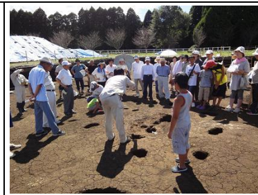
住居跡 柱を立てた穴が残る