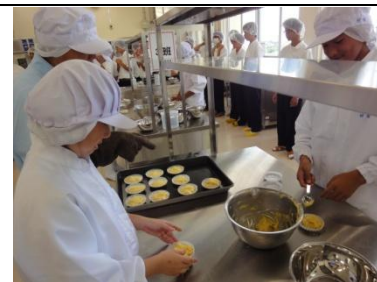
マドレーヌ作りを電気科が見学

○他学科への興味・関心を高め、学科間のコラボレーション(共同研究)、生徒の進路・科目選択に資することを期待して、9月は実習見学を実施しています。初日は、農業科食品加工のマドレーヌ作り、経営情報科のエクセルによる表・グラフ作成を電気科・商業科が熱心に見学しました。次回は、時間のある先生方も生徒の状況を知るいい機会ですので、見学に参加してほしいと思います。