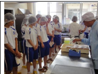
出来上がったマドレーヌ

☆食品加工棟は、宮崎県食品衛生協会から、「菓子製造業」としての営業許可を得ています。衛生管理にはかなり気を配る必要があります。今回の実習見学でも、見学者全員に頭にキャップをかぶってもらい、髪の毛が食品に入らないように、また、テーブルや器具などに手を触れて、細菌が付いたりしないようになど気を配りました。みんなが日頃から衛生管理には十分気を付けたいものです。