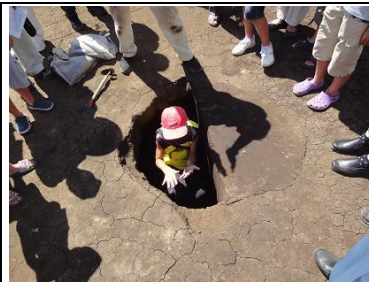
食物貯蔵のための穴に入る