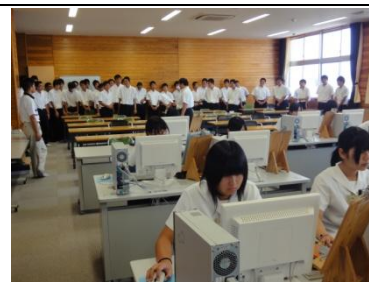
エクセルによる表・グラフ作成