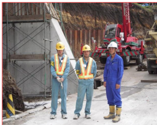
【土木建築 道路改良工事 小林市水流迫】