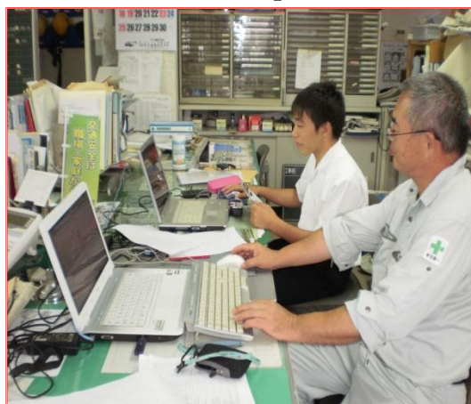
【JW : CAD 実習】