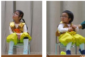
元気にお返事できるかな？