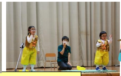
「やまびこさ〜ん」「やっほお〜」「まねっこさ〜ん」「やっほお〜」