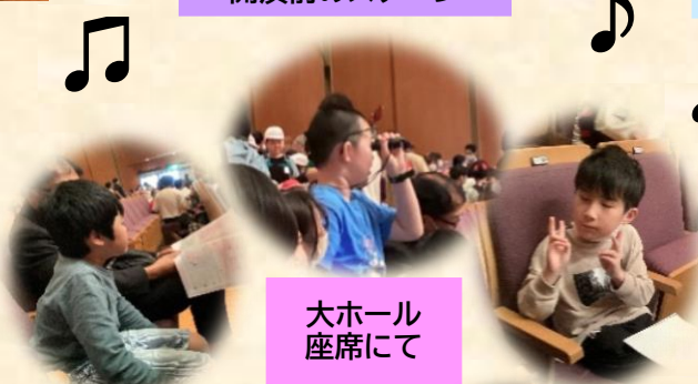
大ホール 座席にて