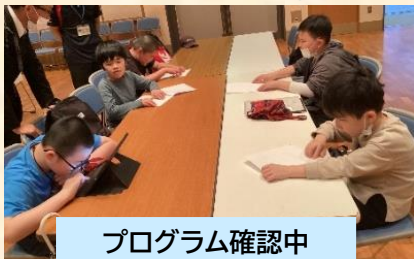
プログラム確認中