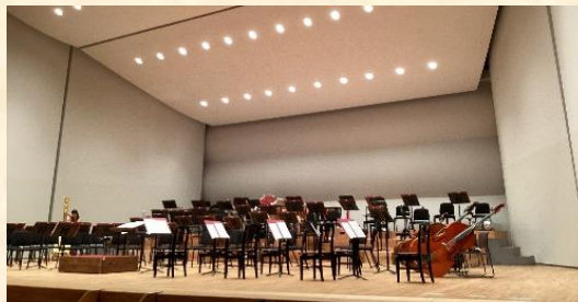
開演前のステージ