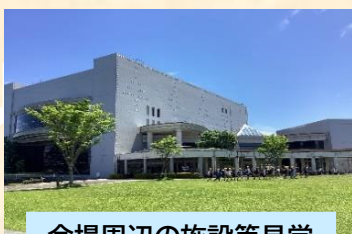
会場周辺の施設等見学