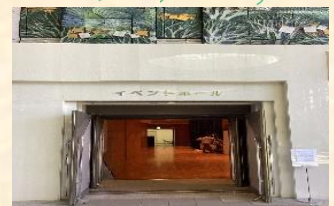
イベントホールでお弁当