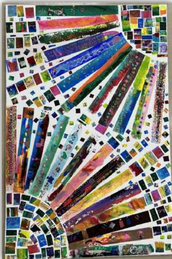
令和6年度中学部2年合同作品「光れ!みんなの心」