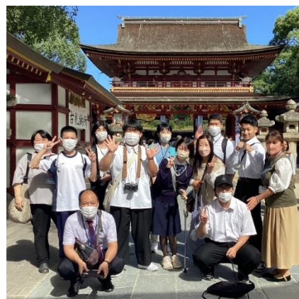
太宰府天満宮にて