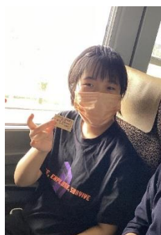
大好きな電車に乗りました

アミュプラザ宮崎に行きました。それぞれ電車と自家用車で宮崎駅に集合。みんなで買い物を楽しみました。