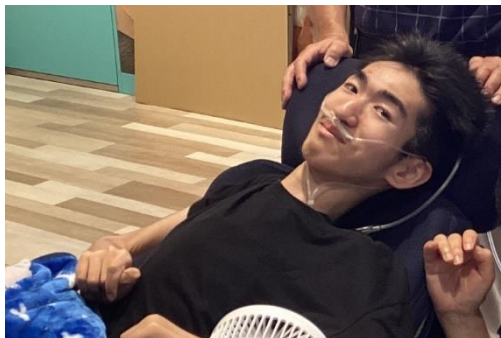
お気に入りのカレンダーを見つけました