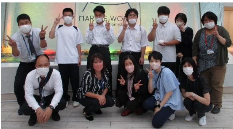
マリンワールドにて

福岡に1泊2日、飛行機、バスの旅でした。マリンワールド海の中道、太宰府天満宮など、福岡の文化や歴史、そしておいしい食べ物に出会いました。全員が楽しく過ごせるようにお互いを思いやり、気遣いあった2日間でした。