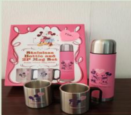
ステンレスボトル・マグセット ボトル500ml/マグ200ml