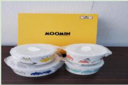
ムーミン・ボウルセット