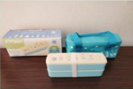
ムーミン・ランチボックス 保冷バック付き