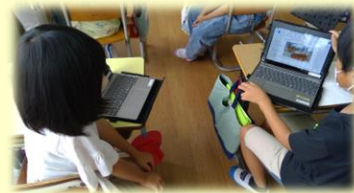
【公開授業に向けた研究授業の様子】