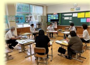
【公開授業に向けた研究協議の様子】