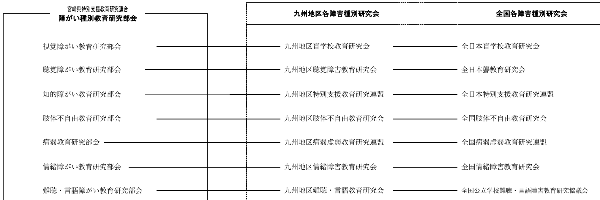
図 2 : 障がい種別教育研究部会と関係機関との連携