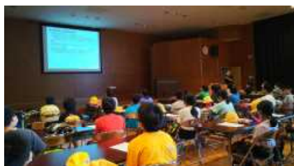
農業試験場での研修