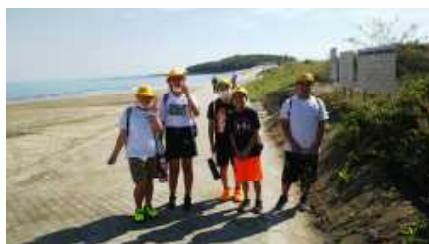
青島を散策する児童

9月10日（木）・11日（金）の、1泊2日の日程で修学旅行を実施しました。例年、鹿児島県への旅行でしたが、コロナの影響で今年度は、県内に変更しました。家族で訪れたことのある場所でも、クラスの間などと一緒にと雰囲気も感動もまた違ったものになったと思います。そして、宮崎の新しい発見もありました。