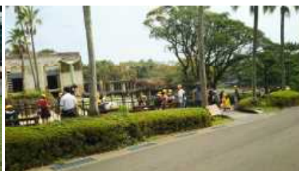
フェニックス自然動物園