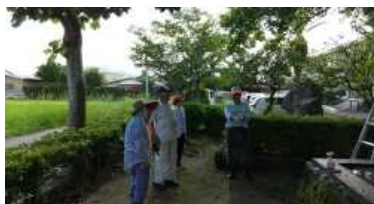
東郷地域協議会のボランティア清掃の皆様