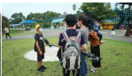
UMKの取材を受ける児童