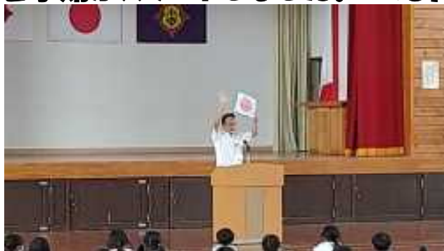
長田校長先生のお話