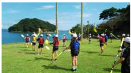
シーカヤックの練習