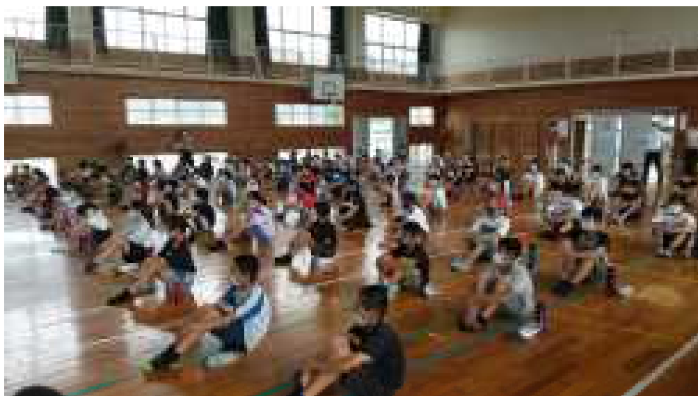
始業式での児童の様子

コロナ感染拡大防止対策のため、3密を避ける手立てとして、下学年、上学年、中学生と3つのグループに分かれて、始業式を行いました。