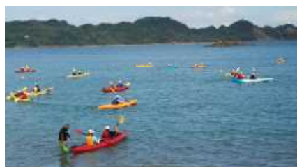
シーカヤック体験